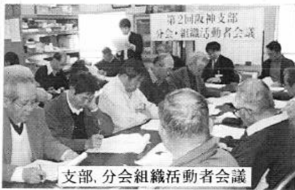
支部、分会組織活動者会議

また、前期拡大月間 の結果は本部割り当て お名のところ27名の加 入に留まり、マイナス 6名となり今一つ惜し い結果となりました。 支部では、事業所へ ダイレクトメールを送 り、電話作戦と訪問を し、加入していただい けるよう努めて行きます。 組合員と組合との感 心を近づけるためにも