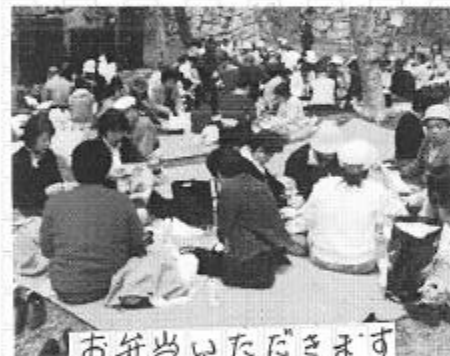
お弁当いただきます

も修復していません。『女性は偉大です』と言われるみたいです。先人の女性達の苦勞の働きをいと思つた。『21世紀は女性の世紀』と言われるいます。寒い冬に花の力をたくわえ時をまっけて皆んなに幸せを届ける桜のように、女性の力とやさしい心で平和の世紀にしたいものです。