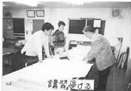
り最後まで三人で講習実技共に終了するこ