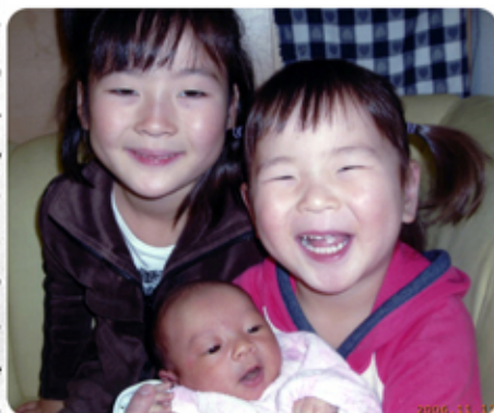
私達美人三姉妹で〜す