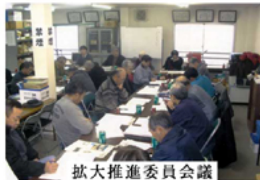
拡大推進委員会議