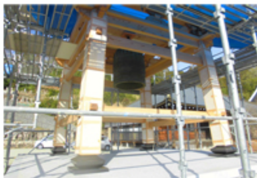
風格も堂々たる大鐘楼

日無事建て前をするこ とができました。 梵鐘の重量は800 キロ、柱はケマキの九 寸角で下での間隔は九 尺四寸、高さ九尺で五 分の転び、竣工は初夏 の予定です。