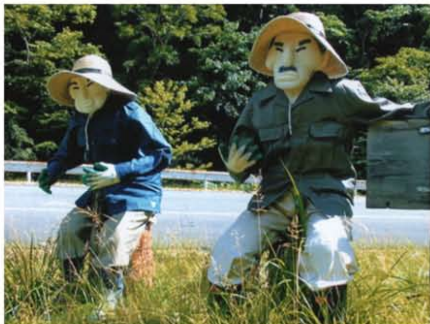
「今年もガンバルべえ婆さんよ」 「爺さんも達者でな頼みますよ」