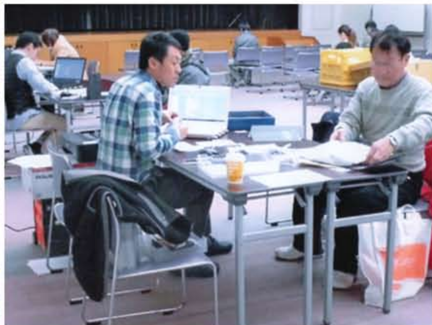
静かで落ちついた雰囲気の中女性センター トレピエで行われた税金申告相談会