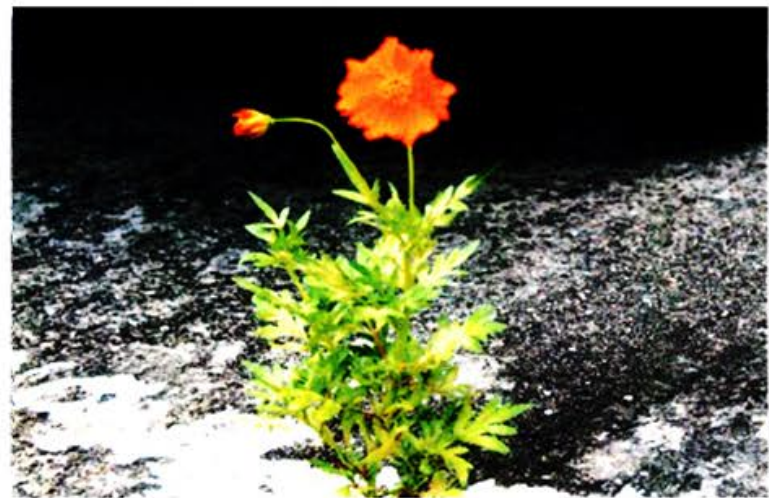
ファイト、負けたらあかん

植物の生命 力には、時ど き驚かされる ことも。 なぜこんな 所にとっても ど、厳しい環 境下でも生育 する姿に、感 動し、勇気を もらうことも たびたびあり ます。