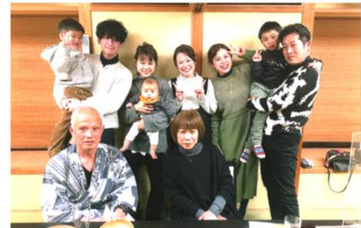
家族にお祝いをしてもらいました

このたび私の 古稀にあたり、 丁寧な御祝いを 頂き誠にありが とうございます。 いろいろな方 がだに支えられ たことを感謝し ています。 家族にも祝つ てもうい、とて もううれしい古稀