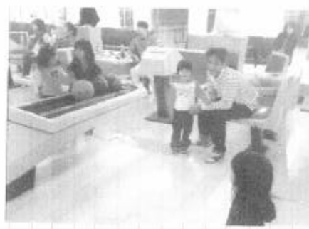
〈去年のホーリング大会〉