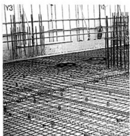
Y3 ぼくが、今行っている現場の鉄筋のスラブ配鉄写真に写ります。この建物は14階建て、ここから出来上がるのが楽しみです。