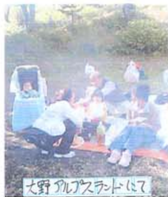
大野アルプスランドにて

みなさんも今後青年 部レクリエーションで 企画してほしい事や履 問などありましたら、