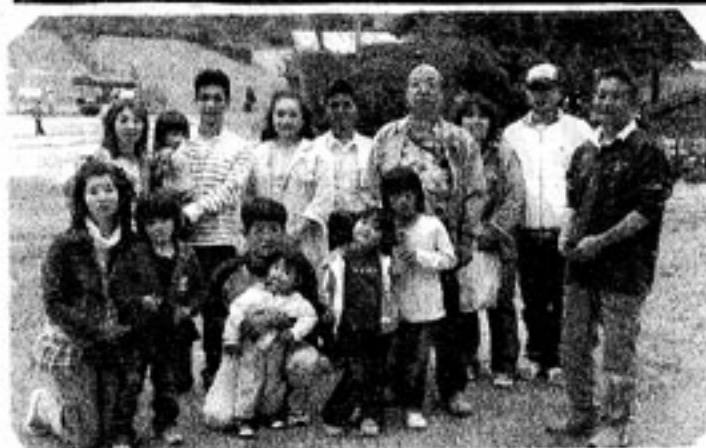
六甲カントリーハウスにて