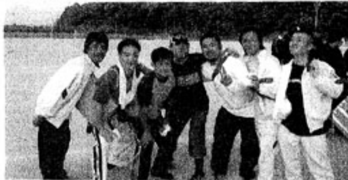
<洋優勝のメンバー>